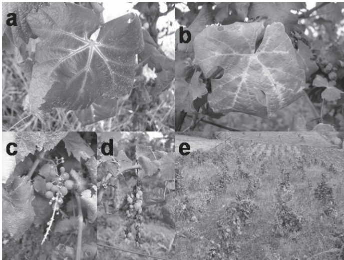
Sl.1. Fitoplazmoze vinove loze Symptoms of phytoplasmas in grapevine

Prepoznavanje fitoplazmoza vinove loze i utvrđivanje raširenosti fitoplazmoza vinove loze u Srbiji. U cilju utvrđivanja pojave i prisustva fitoplazmoza na vinovoj lozi u Srbiji, pregledani su vinogradi u većini vinogorja u Srbiji dva puta u toku vegetacije u periodu od 2003 do 2005. godine. Prvi pregled je izveden tokom juna, kada se na obolelim čokotima ispoljavaju prve patološke promene, a drugi krajem septembra kada se na obolelim čokotima vinove loze može uočiti niz raznih simptoma, odnosno sindrom fitoplazmoza vinove loze (sl.1).