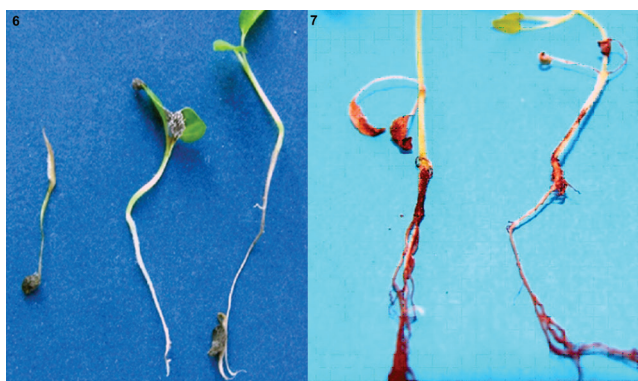
Slika 6-7. - Althea officinalis .- klijanac bez formiranog korenčića i deformacija liske usled napada Fusarium oxysporum (desno: zdrav klijanac) (Sl. 6); Salvia officinalis .- nekroza korenčića stabaceta sejanaca zaraženog sa Fusarium verticillioides (Sl. 7)

Figure 1-5. - Echinacea-purpurea .- non-germinated seed because of heavy infection with Fusarium oxysporum and F.proliferatum (Fig. 1); Althea officinalis . - non-germinated seed due to infection with Fusarium verticillioides (Fig. 2), Echinacea purpurea . - non-sprouted seed due to a strong attack of Alternaria sp. (Fig. 3), Althea officinalis . - non-germinated seed due to mixed infection with Alternaria sp. and Fusarium spp. (Fig. 4); Althea officinalis . - Mycopopulation on not sterilized (right) and sterilized seeds (Fig. 5).