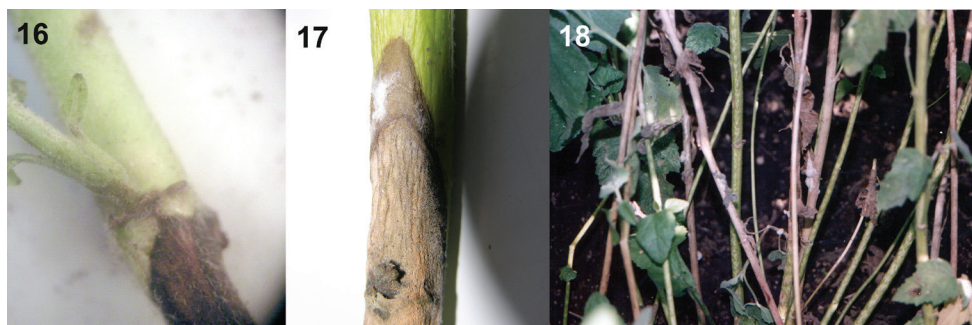
Slika 16-18. - Salvia officinalis - nekroza prizemnog dela stabla usled mešane infekcije sa Alternaria sp. i Fusarium spp. (Sl. 16); Althea officinalis . - pegavost i nekroza stabla usled mešane infekcije sa Fusarium semitectum i F.verticillioides (Sl. 17); bela trulež stabla prouzrokovana sa Sclerotinia sclerotivorum (Sl. 18).

Figure 14-15. - Althea officinalis . - Root and root collar rot induced by Sclerotinia sclerotiorum (Fig. 14); cross-section with a strong root necrosis and formed sclerotia (Fig. 15)