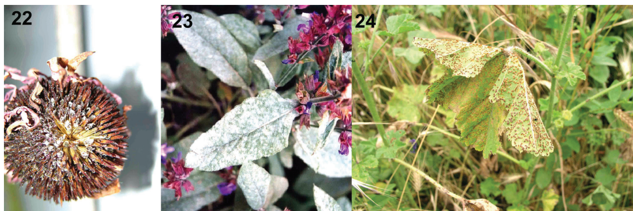
Slika 22-24.- Echinacea purpure .- sušenje cveta usled napada Fusarium verticilioides (Sl. 22); Salvia officinalis .- pepelnica na listovima (Sl. 23); Malva silvestris .- rđa lista uzrokovana sa Puccinia malvacearum (Sl. 24)

Figure 19-21. - Echinacea purpure . - White stem rot (Fig. 19); brown leaf spot caused by Alternaria alternata (Fig. 20); rot of floral branches and flowers due to infection with Botrytis cinerama (Fig. 21).