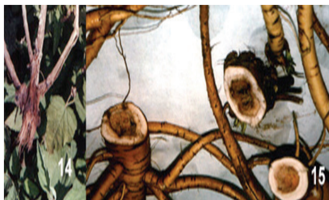
Slika 14-15. - Althea officinalis . - trulež korena i korenovog vrata izazvan sa Sclerotinia sclerotiorum (Sl.14); poprečni presek korena sa jakom nekrozom i formiranim sklerocijama (Sl. 15)

Figure 8-13. - Echinacea purpurea . - Root and crown rot caused by Fusarium oxysporum (Fig. 8); Althea officinalis . - Severe necrosis of roots and root crown infected with Fusarium oxysporum (Fig. 9 and 10); root necrosis caused by mix infection of Fusarium verticillioides , F.semitectum and F.oxysporum (Fig. 11); cross section of root infected with Fusarium verticillioides (Fig. 12); necrosis of the root collar due to the presence of Fusarium semitectum and F.oxysporum (Fig. 13)