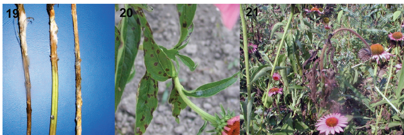
Slika 19-21.- Echinacea purpure .- bela trulež stabla (Sl. 19); mrka pegavost lista prouzrokovana sa Alternaria alternata (Sl. 20); trulež cvetne grane i cvetova usled zaraze sa Botrytis cinere (Sl. 21).

Figure 19-21. - Echinacea purpure . - White stem rot (Fig. 19); brown leaf spot caused by Alternaria alternata (Fig. 20); rot of floral branches and flowers due to infection with Botrytis cinerama (Fig. 21).