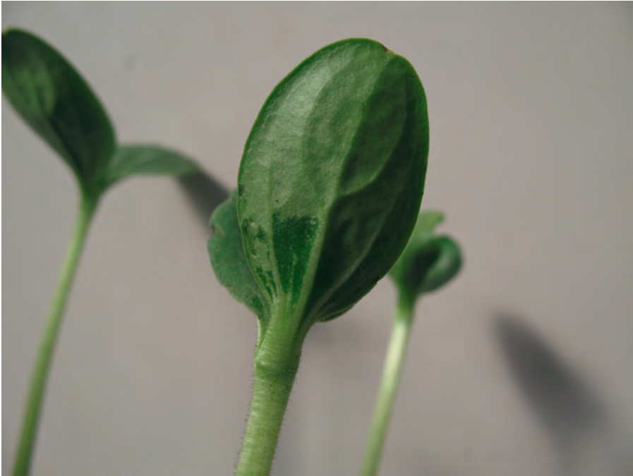
Slika 1. A. citrulli - Pege vodenastog izgleda s naličja kotiledona. Početna faza infekcije.

Najkarakterističniji simptomi bakterijske mrljivosti ispoljavaju se na zrelim plodovima lubenice i dinje. Na lubenici se uočava tamno maslinasto-zelena pega (mrlja) na gornjoj strani ploda, koja je u početku u vidu vodenaste zone veličine nekoliko milimetara, i koja se brzo uvećava do pege prečnika nekoliko centimetara sa nepravilnom ivicom (Slika 2.) (Somodi i sar., 1991). U roku od nekoliko dana, pege se mogu proširiti na ostatak površine ploda, ostavljajući samo donji deo ploda bez simptoma. Pege su posebno vidljive pred zrenje plodova (OEPP/EPPO, 2016). Vremenom tkivo u okviru pega nekrotira i puca, a kroz nastale lezije prodiru i drugi patogeni, pa tako dolazi do razmekšavanja unutrašnjeg tkiva ploda. Oboleli plodovi su potpuno neupotrebljivi i nemaju komercijalnu vrednost (Obradović i sar., 2014).