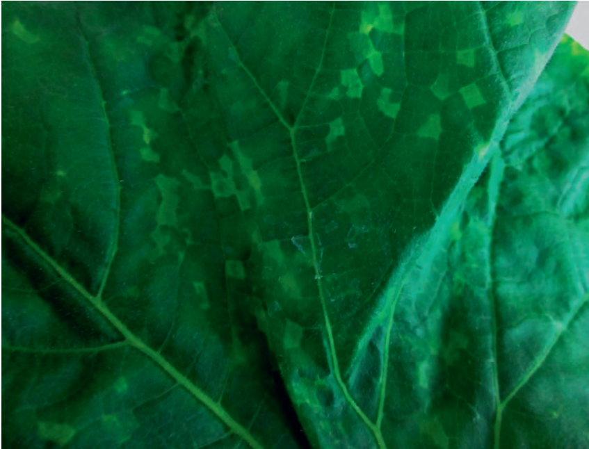
Slika 3. P. s. pv. syringae - Uglaste, svetlozelene pege na listovima krastavca.

i drugi patogeni varijeteti P. syringae , koji mogu biti filogenetski dosta udaljeni (Slika 3.) (Slomnicka i sar., 2015; Newberry i sar., 2016; Zlatković, 2018; Newberry i sar., 2019). Takođe, na osnovu dobijenih rezultata, utvrđeno je da u okviru vrste P. syringae sensu lato , postoji veliki genetički diverzitet (Newberry i sar., 2016).