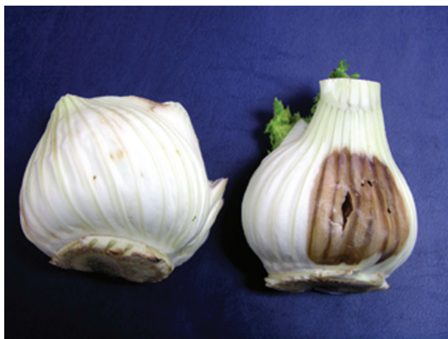
Sl. 2 - Pectobacterium carotovorum subsp. carotovorum . Vlažna trulež inokuliranih glavica komorača.

Fig. 1 - Pectobacterium carotovorum subsp. carotovorum . Soft rot og fennel bulbs (natural infection).