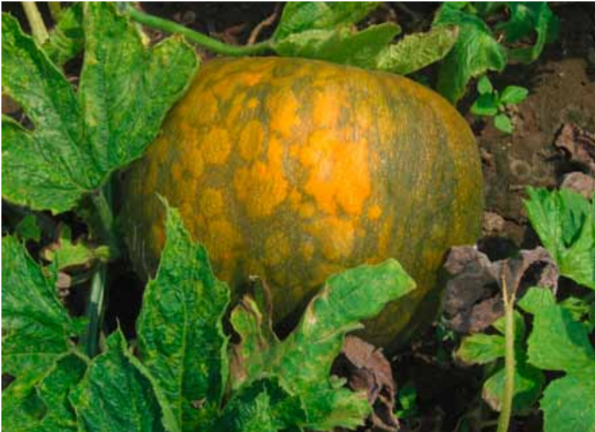
Slika 6. Mešana infekcija WMV i ZYMV: bradavičavost i promena boje ploda