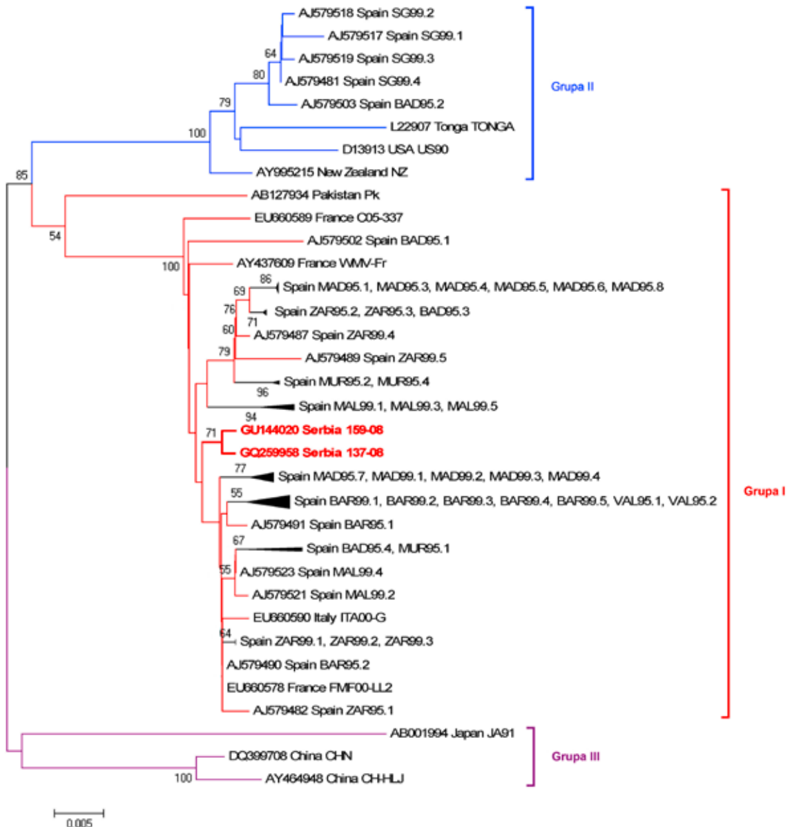
Slika 8. Filogenetsko stablo rekonstruisano na osnovu delimičnih sekvenci CP gena 57 izolata WMV korišćenjem MEGA4 softvera i Neighbour-Joining metode sa bootstrap analizom u 1000 ponavljanja. Dužina grana je proporcionalna broju promena baznih parova. Izolati iz Srbije označeni su crvenom bojom.

Razlike u pojavi, rasprostranjenosti i učestalosti virusa koji se prenose vašima na neperzistentan način zavise od godine i lokaliteta često se javljaju kod virusa tikava i u drugim delovima sveta (Tóbiás i Tulipán, 2002; Lecoq i sar., 2003). Ipak, situacija 2009. godine bila je iznenađujuća zbog pojave WMV u malom broju lokaliteta, malom broju useva i malom broju testiranih uzoraka. Za viruse tikava navodi se da su ne samo složeni već i izrazito promenljivi patološki sistemi zbog