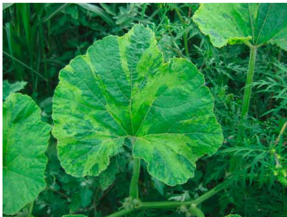
Slika 4. Mešana infekcija WMV i ZYMV: hlorotično šarenilo lišća