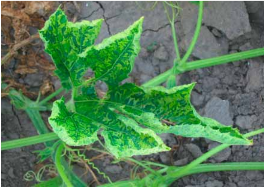
Slika 5. Mešana infekcija WMV i ZYMV: izraženi mozaik i uvijenost lišća