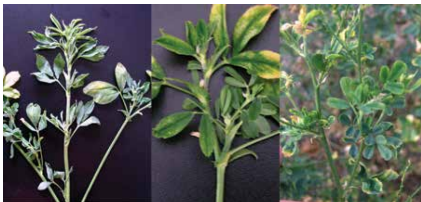
Figure 1. Early symptoms of phytoplasma disease (shoot proliferation, short internods, phyllody and small atypical leaves)

Slika 1. Početni simptomi – proliferacija izdanaka, skraćene internodije, filodije i sitno atipično lišće