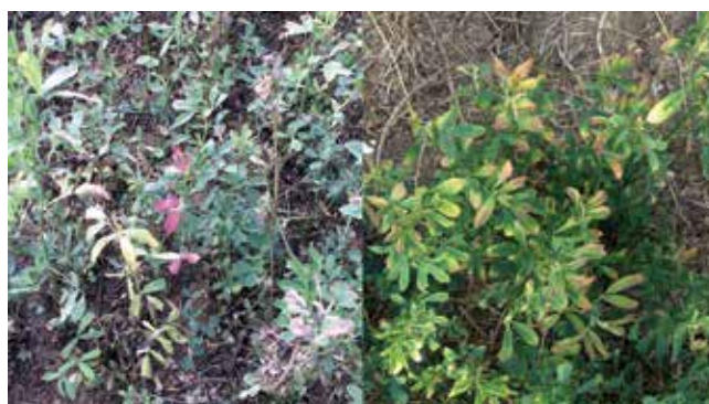
Figure 3. Diseased plants failing to flower