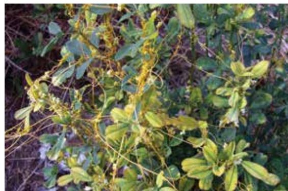
Slika 4. Vilina kosica – vector fitoplazmi u lucerki

u Tulešu, 40 % Sićevu, 60% Ljubavi i 80 % u Belanovici (Graf. 1). Godišnji indeks porasta zaraze kretao se od 2 do 6. U lokalitetu Belanovice konstatovano je značajno prisustvo viline kosice ( Cuscuta ) (Sl. 4), čime se može objasniti najviši godišnji indeks porasta zaraze.