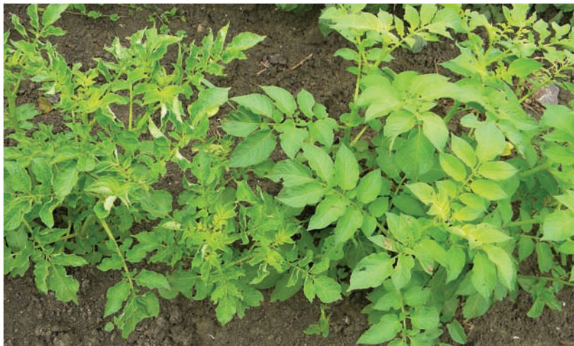
Sl. 2. Simptomi mešane zaraze nekrotičnim sojem Y virusa i virusom uvijenosti lišća krompira (levo) i zdrava biljka (desno)

Simptomi. Najprepoznatljiviji simptomi ovog virusa manifestuju se u vidu uvijanja liski ka licu. Ovi simptomi, međutim mogu biti uslovljeni i drugim abiotskim i biotskim faktorima. Biljke primarno zaražene ovim virusom, reaguju uvijanjem mlađeg, vršnog lišća, koje dobija svetliju boju, dok sekundarno zaraženje biljke ispoljavaju jače uvijanje donjeg, starijeg lišća. Simptomi, kao i kod PVY u funkciji su osetljivosti sorte, soja virusa i perioda infekcije. U zaraženim biljkama javlja se nekroza floema u stablu i krtolama, zbog jačeg obrazovanja kaloze, koja onemogućava normalan transport asimilata i dovodi do taloženja skroba u lišću i uvijanja liski. U našim uslovima biljke zaraženje PLRV najčešće su prethodno zaražene i PVY, što dodatno otežava simptomatologiju (Sl. 2).