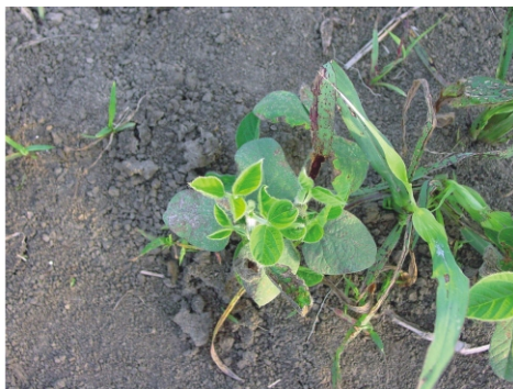
Sl. 2. Obnavljanje oštećenih biljaka (varijanta 16), 19. jun 2006.