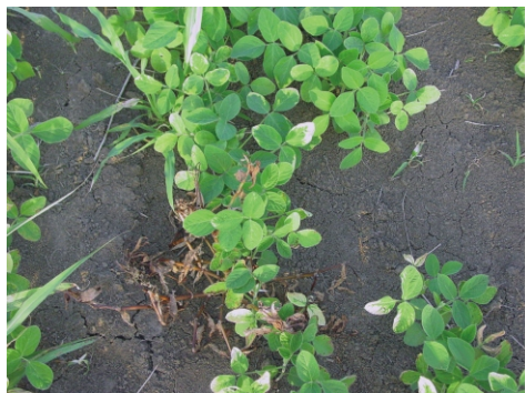
Sl. 1. Izbeljivanje listova soje izazvano primenom herbicida (varijanta 5)

Simptomi fitotoksičnosti na biljkama, njihov obim i jačina, kao i obnavljanje biljaka soje, bili su uočljivi prilikom prve ocene (Sl. na Nasl. str., Sl. 1-2).